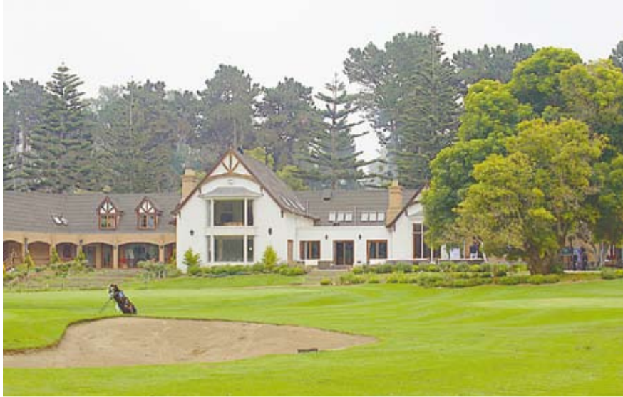
Club de Golf Rocas de Santo Domingo.